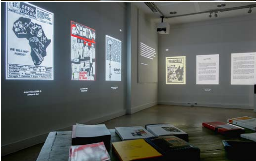
Exposition à l'INHA, 2017